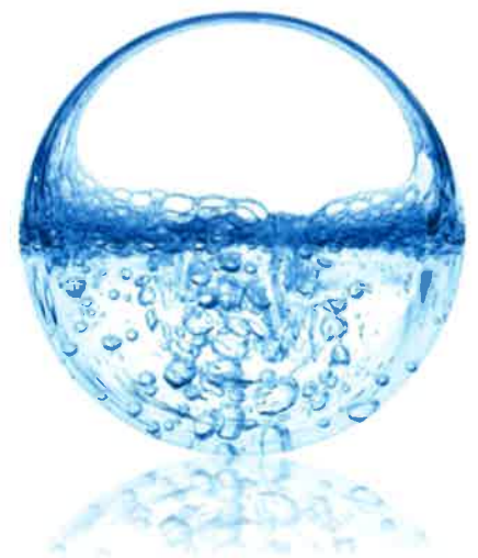
Dual Layer Pearls 定番製品の一例

また、KPT社が推奨する専用ディスペンサーを使用することでヒアルロン酸外膜を微細に破碎でき、皮膚上での伸びが良くなります。