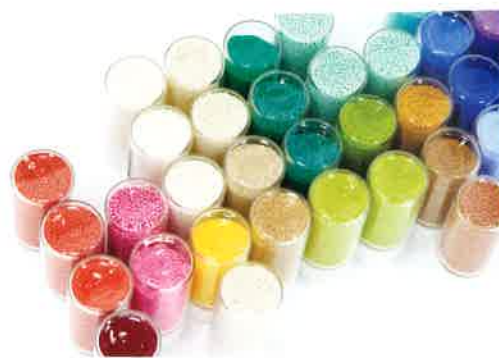
Starphere Visual 定番製品の一例

機能性成分として酢酸トコフェロールをスタンダードで内包する他、カスタマイズにより希望の機能性成分も内包することができます。