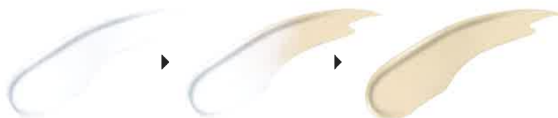
Color Change Brown Capsule