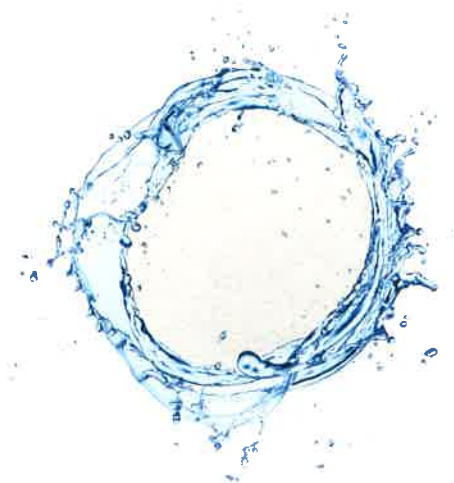
Starphere Functional 定番製品の一例

Visualシリーズよりも機能性に特化したもので、角層細胞間脂質の成分を高濃度に含有します。代表的な細胞間脂質であるセラミドは、通常、難溶解性のため高濃度配合は難しいですが、Starphereとすることで最終濃度数%レベルでの配合が可能となります。